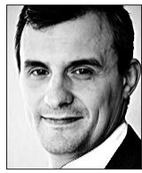
*Directeur de la recherche, Institut économique Molinari

Au lieu de revenir à plus de responsabilité individuelle, plus de choix et plus de concu-